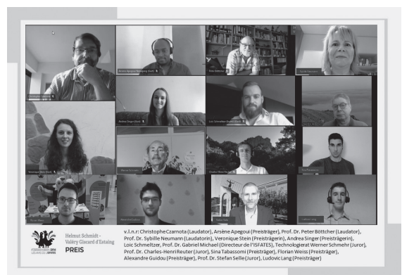
Die Preisträger*innen, Laudator*innen und Jury-Mitglieder auf einen Blick

Hintergrund DFHI-Förderverein: Der im Februar 1990 gegründete Förderverein des DFHI setzt sich im Schulterschluss mit der regionalen Wirtschaft dafür ein, die Ziele des Deutsch-Französischen Hochschulinstituts noch wirksamer zu erreichen und die Studierenden bei ihrer binationalen Ausbildung in insgesamt zwölf Studiengängen finanziell und ideell zu begleiten. 160 Firmen, Institutionen und Privatpersonen aus Deutschland, Frankreich, Luxemburg und der Schweiz sind im Verein Mitglied und fördern Studienprojekte, Exkursionen, Sprachkurse und die Marketing-Aktivitäten des DFHI/ISFATES ( www.htwsaar.de/dfhi-fv ).